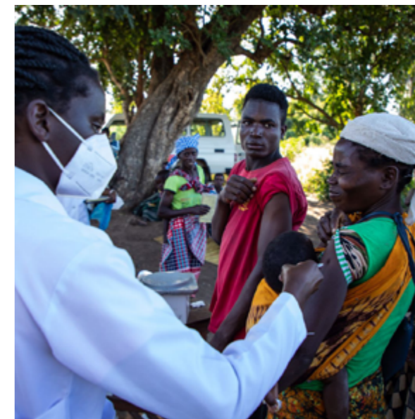
ICRC genomförde ett vaccinprogram mot Covid i Mellersta och Norra Moçambique.

från tiotals organisationer och FN. Trots detta är hjälpbehovet mycket större än hjälpen som ges i området. Enligt FN:s samordningsbyrå för humanitära ärenden (OCHA) samlade man in endast 19 procent av pengarna som skulle ha behövts för att kunna hjälpa i Cabo Delgado.