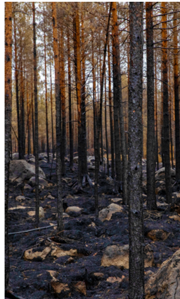
På 1-2-3-konceptets tredje nivå kämpar man med massiva katastrofer, såsom skogsbränder.

Tillsvidare har man under de åren som statistikförts inte lyckats få