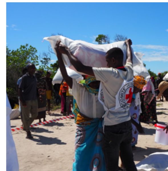
ICRC:s utdelning av biståndsmaterial når de hjälpbehövande på ön Matemo i provinsen Cabo Delgado.