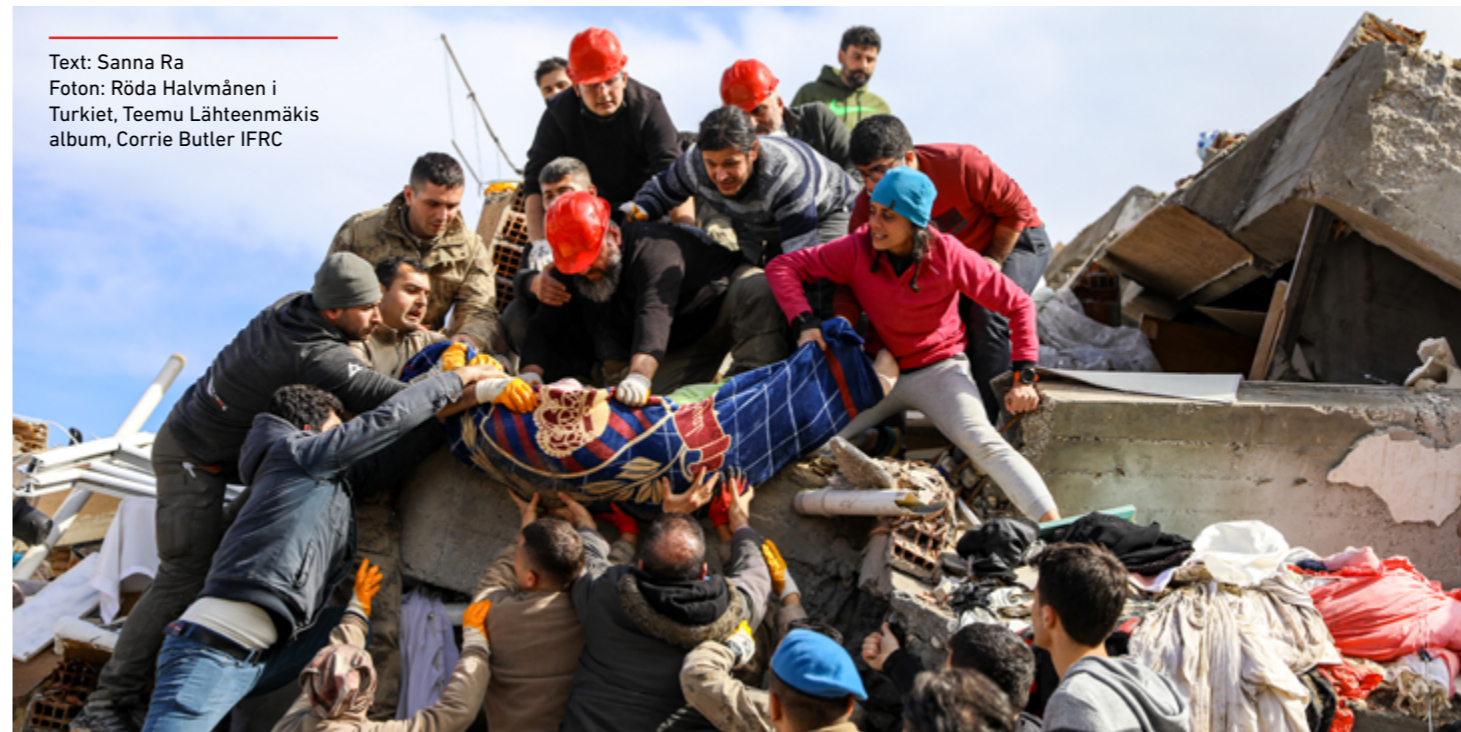
Text: Sanna Ra

Jag hör om utmaningar, som att hur svårt det är att skicka bistånd till Syrien, och om hur självständig och stark den nationella Röda Halvmånen är. Jag är glad och stolt över arbetet som vi utfört, och samtidigt aningen sorgsen över hur många behov som ännu förblev öppna.