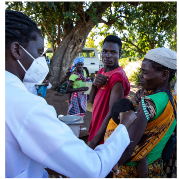
ICRC:n avustustarvikkeiden jakelu tavoittaa avuntarvitsijat Matemon saarella Cabo Delgadon provinssissa.